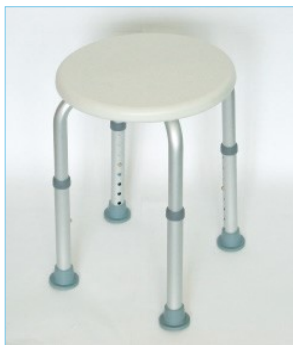
Stuhl komplett - Shower stool complete