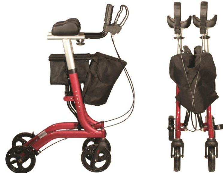
Benutzung der Bremse